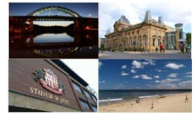
Local Information Pack

您的房屋经理将给您一个 NEMP 网站 的连接 www.nemp.org.uk 该网站包含一个支持服务列表，您可以在其中获得帮助。该网站还告诉您如何照顾自己的健康，以及如何在英国成为一个好父母。该网站还会向您介绍英国的法律。该网站上有各种语言的信息和视频以及简短的在线学习课程。